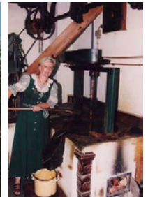
u V 7 U