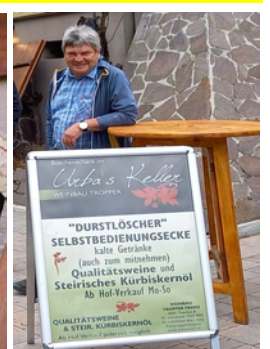
u V u -7 M u k y 7 "