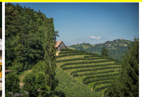
u - 0 0