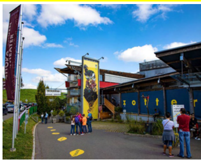
u @ t